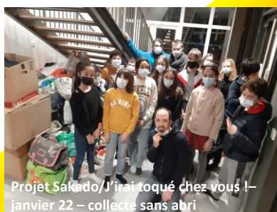
Projet Sakado/ J'installe chez vous ! – janvier 22 – collecte sans abri