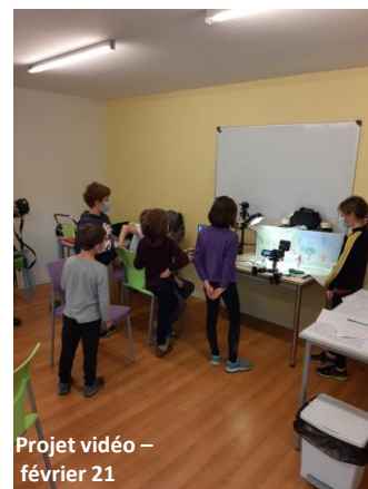
Projet vidéo – février 21