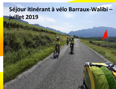
Séjour itinérant à vélo Barraux-Walibi – juillet 2019