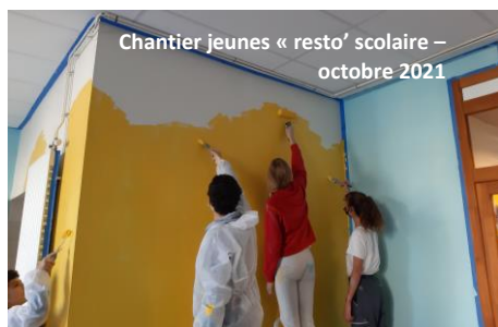
Chantier jeunes « resto' scolaire – octobre 2021