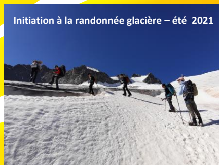
Initiation à la randonnée glacière – été 2021