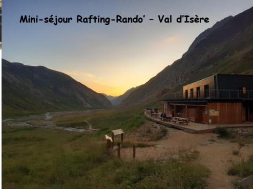
Mini-séjour Rafting-Rando' - Val d'Isère