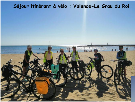
Séjour itinérant à vélo : Valence-Le Grau du Roi